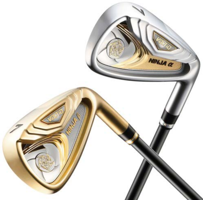
右：『VOLTiO NINJA \alpha (SILVER)』アイアン 左：『VOLTiO NINJA \beta (GOLD)』アイアン

「クリーンヒットできない」「番手通りの距離が出せない」「フェースが開いてスライスする」アイアンショットの悩みを追求し、ヘッドの大きさと重心距離で解決。簡単に距離が出せる大き目のヘッドに、キャビティ内部の重量配分とタングステンプレートによる大胆不敵な重心配置を行うことで、かつてない「つかまり」を実現しました。どこよりも「やさしく飛ぶアイアン」を作る。『VOLTiO NINJA \alpha / \beta アイアン』は、その意志と独創と技術が結晶した8本です。